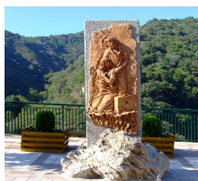
Immagini ritraenti scorci di Antillo

L'asino è uno degli animali più noti nell'ambito delle tradizioni e del folklore siciliano.